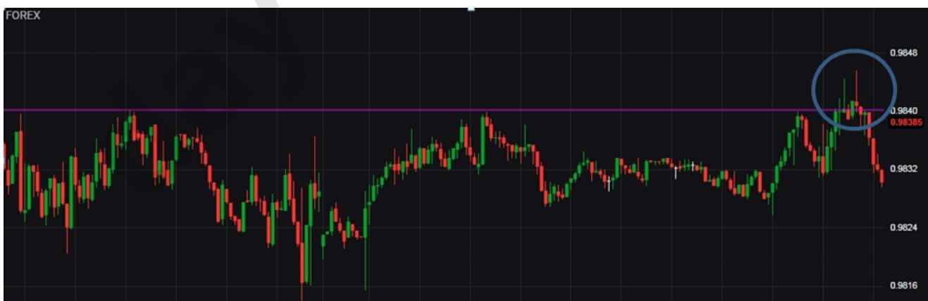
fig. 3. Eksempel på et falsk brud i et valutakryds. Se cirkel.

Det er ikke svært at forstå, hvorfor pricebreaks virker tillokkende for mange tradere. Når man kigger tilbage på tidligere pricebreaks og ser hvor store bevægelser de skabte, kan man nemt komme til at ærge sig over, at man ikke var inde i markedet på netop dette tidspunkt. Pricebreaks er dog ofte lige så tillokkende, som de er farlige. Se for eksempel følgende eksempler, hvor et pricebreak ender som et "falsk signal".