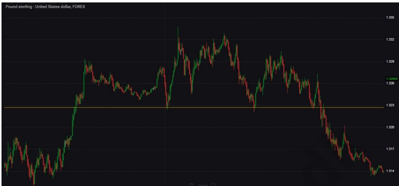
fig. 2. Pricebreak i prisen på GBPUSD.

Det er ikke svært at forstå, hvorfor pricebreaks virker tillokkende for mange tradere. Når man kigger tilbage på tidligere pricebreaks og ser hvor store bevægelser de skabte, kan man nemt komme til at ærge sig over, at man ikke var inde i markedet på netop dette tidspunkt. Pricebreaks er dog ofte lige så tillokkende, som de er farlige. Se for eksempel følgende eksempler, hvor et pricebreak ender som et "falsk signal".