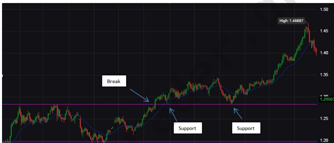
fig. 5. Genbesøgte pricebreaks forekommer ofte.

tålmodighed at vente på et sådan re-trace, og ofte vil man gå glip af en handel, fordi kursen alligevel ikke vender, men blot fortsætter videre. Alligevel kan det være besværet værd at vente på et re-trace. Når først man har konstateret, at den gamle modstand nu pludselig virker som støtte, er der desto større vished for, at brudet for alvor er en realitet. I nedenstående graf ses, hvordan modstanden brydes, hvorefter niveauet kort efter bliver til støtte i to omgange, før prisen dernæst for alvor tager fart mod nord.