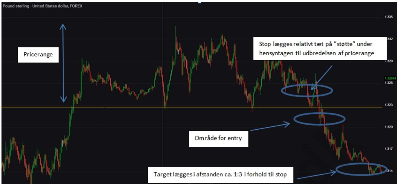
fig. 6. Eksempel på handel under et pricebreak. Her i krydset GBPUSD.

Vil du daytrade? Vi anbefaler handelsplatformen Markets Se mere